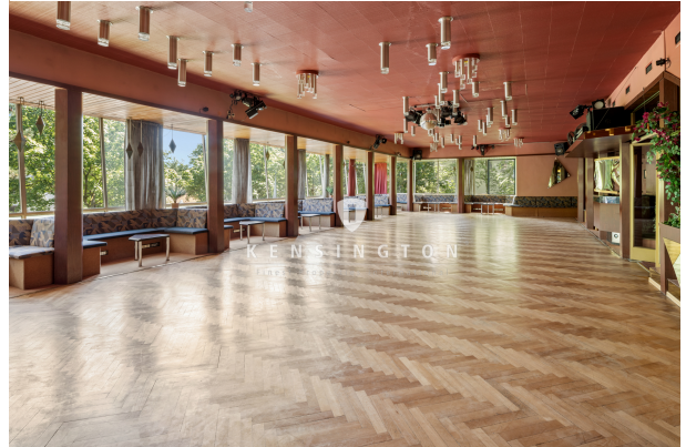
Raum 2 im Abrissgebäude