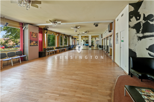
Raum 1 im Abrissgebäude