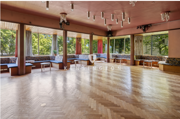
Blick ins Grüne