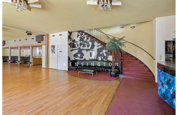
Treppe im Abrissgebäude