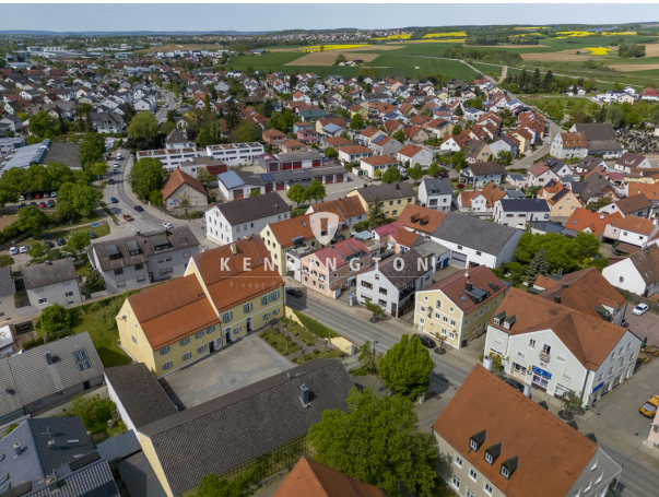
Mitten im schönen Kösching!