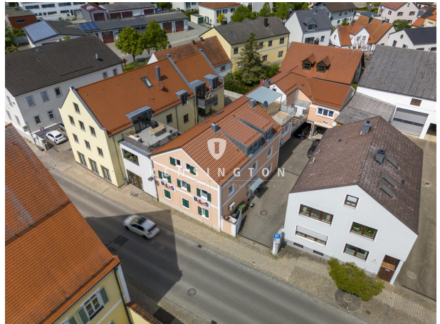
Optimal zentral gelegen!