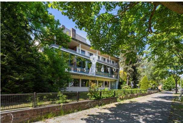
mögliches neues Gebäude mit Baugenehmigung